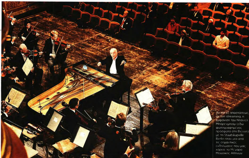
Αν και εξ αποστάσεως, σε live streaming, η εμφάνιση του Ντάνιελ Μπάρενμποϊμ (εδώ φωτογραφημένος πρόσφατα στη Βιέννη) με τη Staatskapelle Berlin ήταν μια από τις σημαντικές εκδηλώσεις που μας χάρισε το Μέγαρο Μουσικής Αθηνών