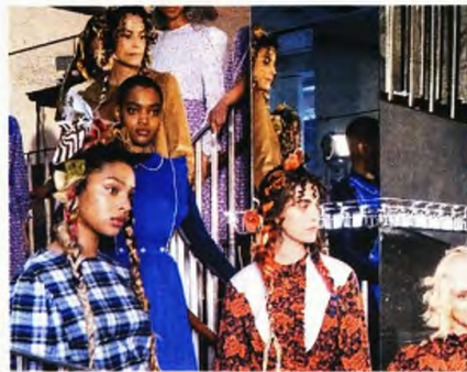
Μέλη της Ομάδας Χορού Batsheva που παρακολουθήσαμε σε live streaming του Μεγάρου Μουσικής Αθηνών