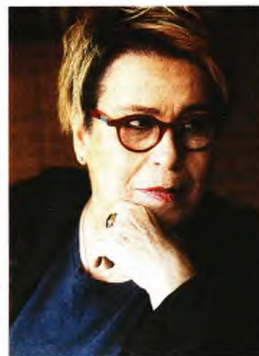
Η Δήμητρα Γαλάνη και ο Διονύσιος Σαββόπουλος περιλαμβάνονται στους καλλιτέχνες που εμφανίστηκαν στο Μέγαρο Μουσικής Αθηνών πριν από την αναστολή της λειτουργίας του