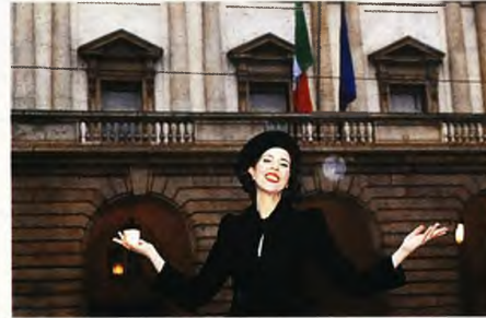
Η Λιζέτ Οροπέσα είναι μία από τις σταρ που πήραν μέρος στο εναρκτήριο γκαλά της Σκάλας του Μιλάνου